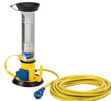
MGL 1260 STANDART

стандарт розеток на выбор (французский, датский, низковольтный и т.д.) два вида магнитных креплений