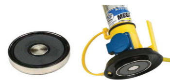
Магнитное крепление 600N