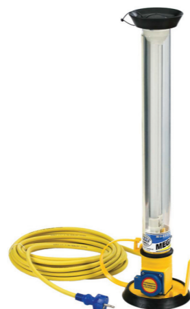
MGL 1360 STANDART