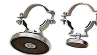
Магнитное крепление для MGL PIPE