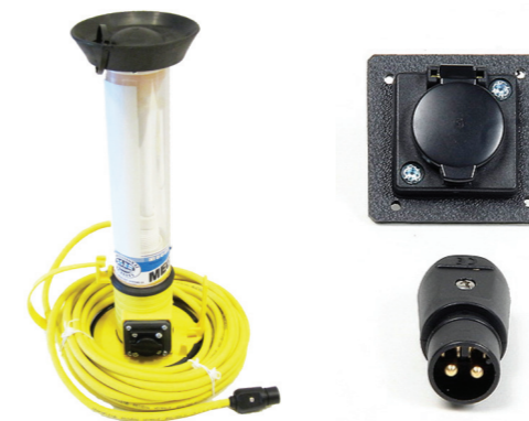
MGL 1x26W/24V STANDART SAFETY с низковольтной вилкой и розеткой